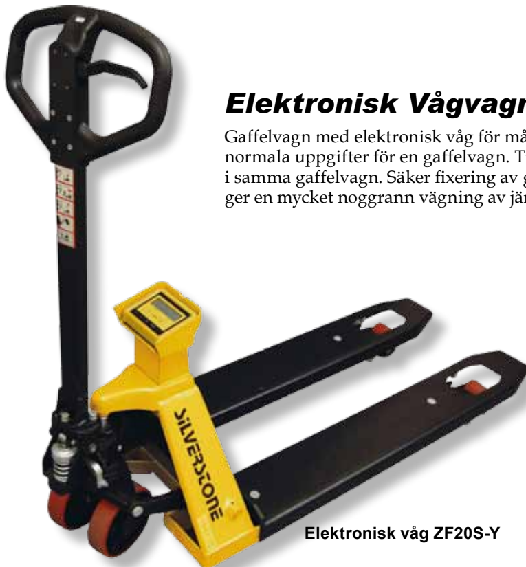
Elektronisk våg ZF20S-Y

Denna mycket populära gaffellyftvagn har en robust grundkonstruktion som ger en lång livslängd. Hydraulpumpen är beprövad med ett kullager i toppen mot chassit samt ordentliga smörjnipllar på hela vagnen. Detta gör Pro Line till en av marknadens mest prisvärda Gaffellyftvagn. Finns i längderna 910 samt 1150 mm och med olika hjulalternativ. Lyftkapacitet 2500 kg.